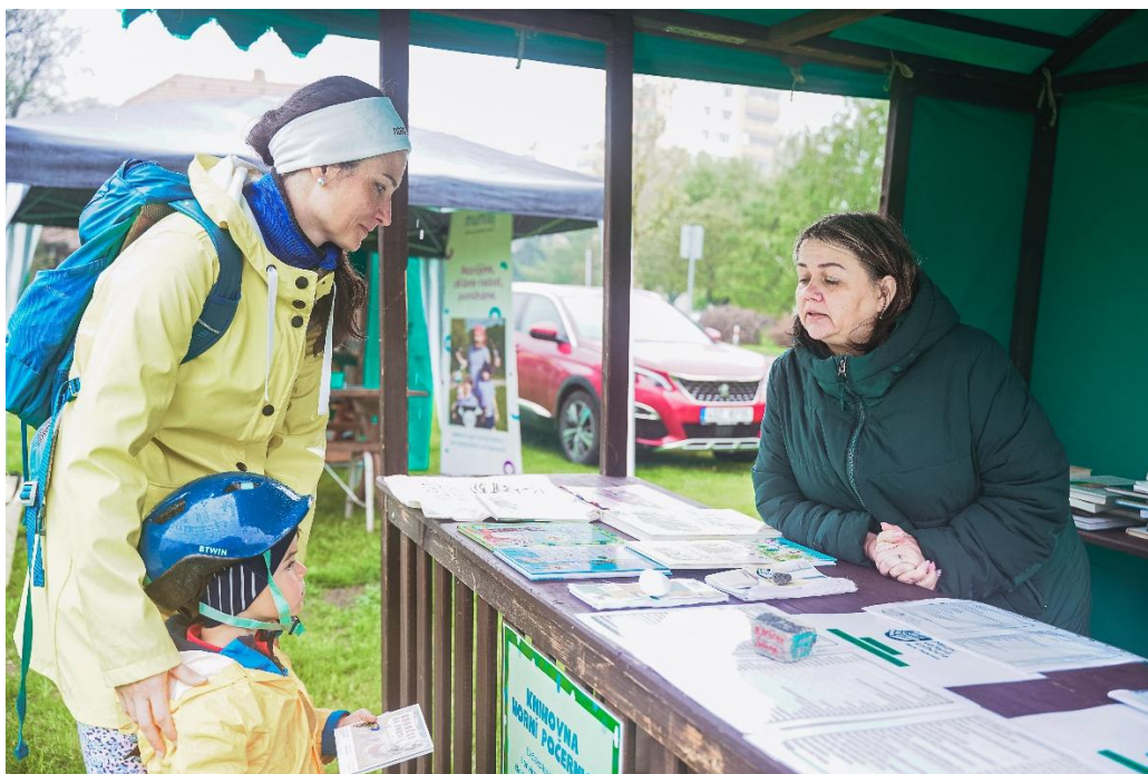
Obrázek18: Akce MČ Den Země