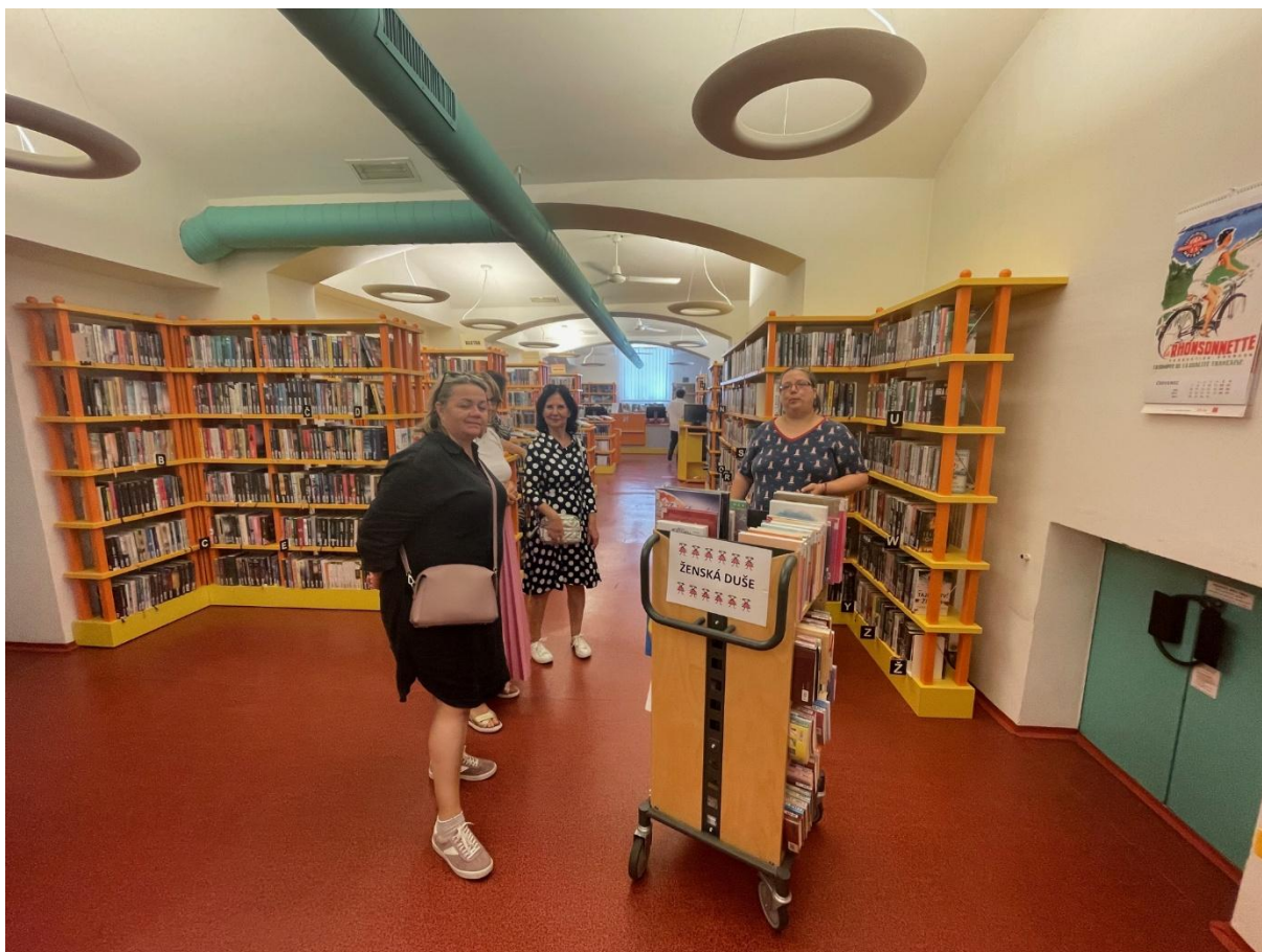
Obrázek 16: Exkurze – Knihovna na Vinohradech