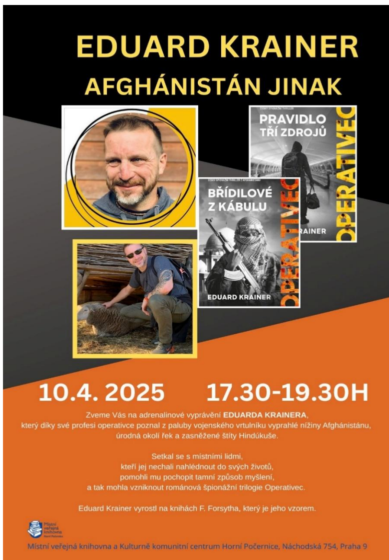
Obrázek 3: Plakát na akci beseda s autorem