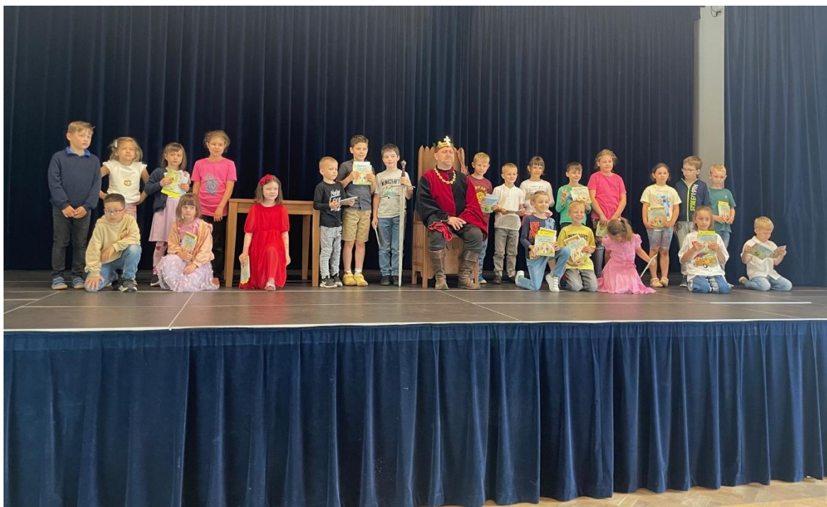
Obrázek 10: Pasování prvňáčků na čtenáře