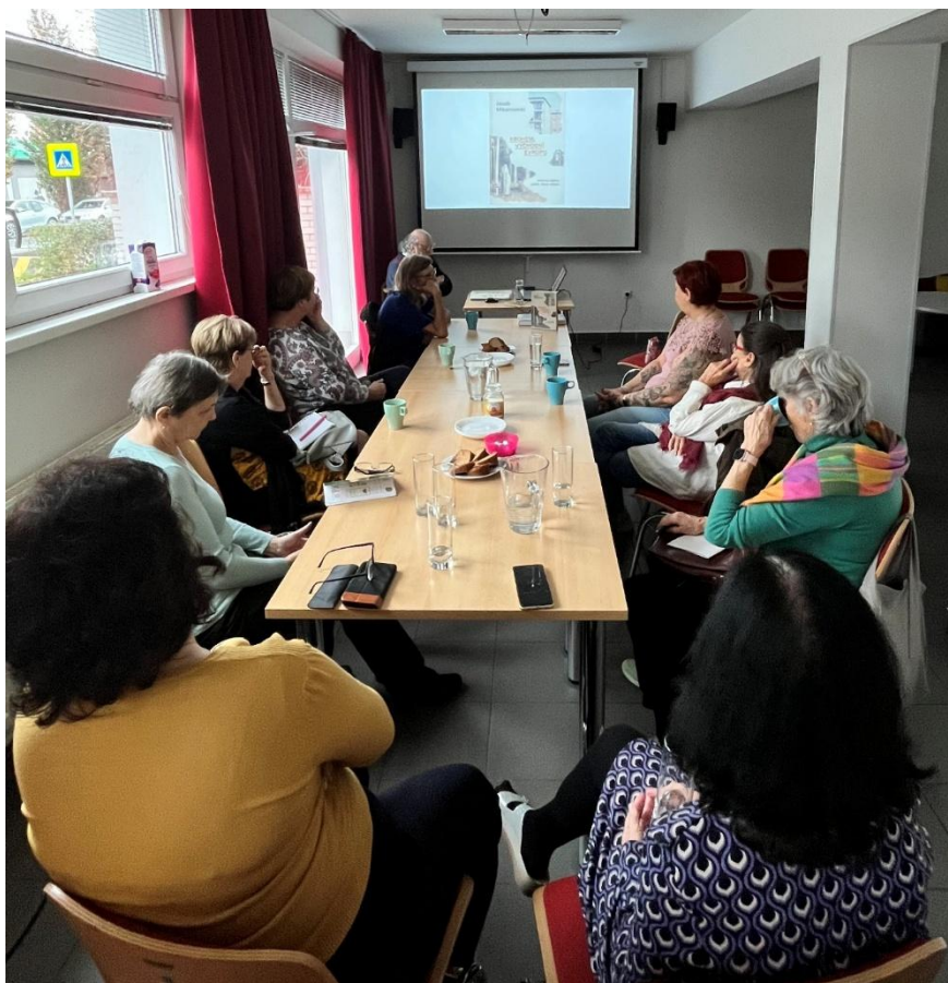
Obrázek 7: Čtenářský klub