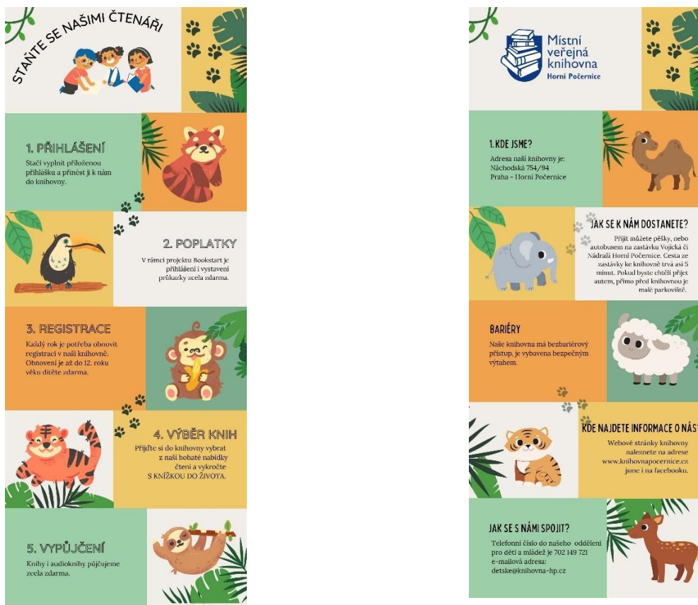
Obrázek 12: Brožurka – 5 kroků ke čtenářství