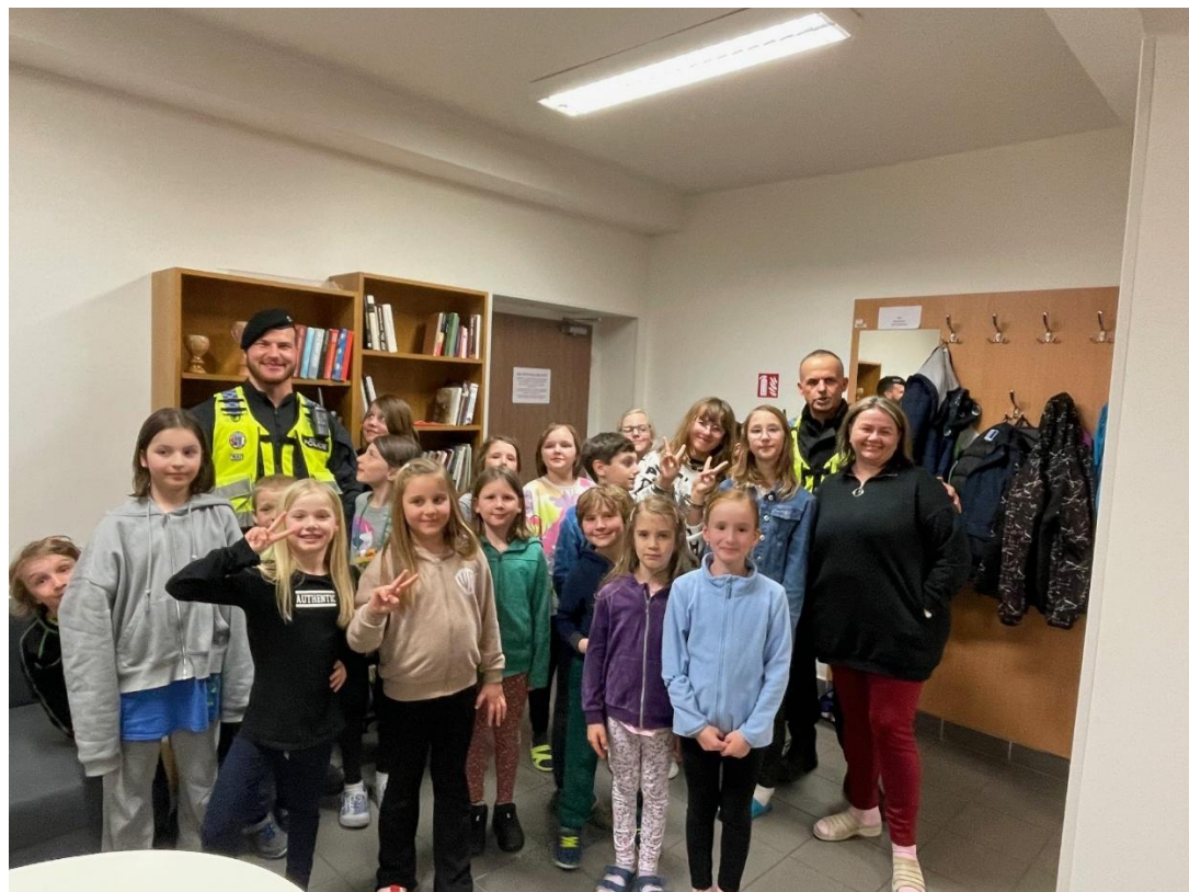
Obrázek 6: Noc s Andersenem – návštěva strážníků městské policie