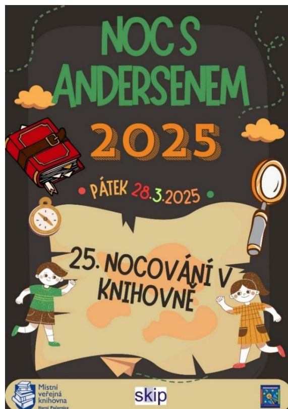
Obrázek 13: Notýsek pro děti na akci Noc s Andersenem