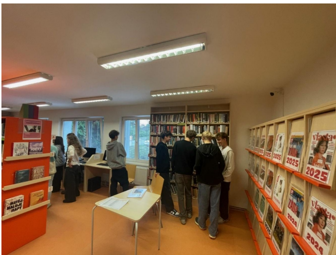
Obrázek 11: Program pro Gymnázium Chodovická