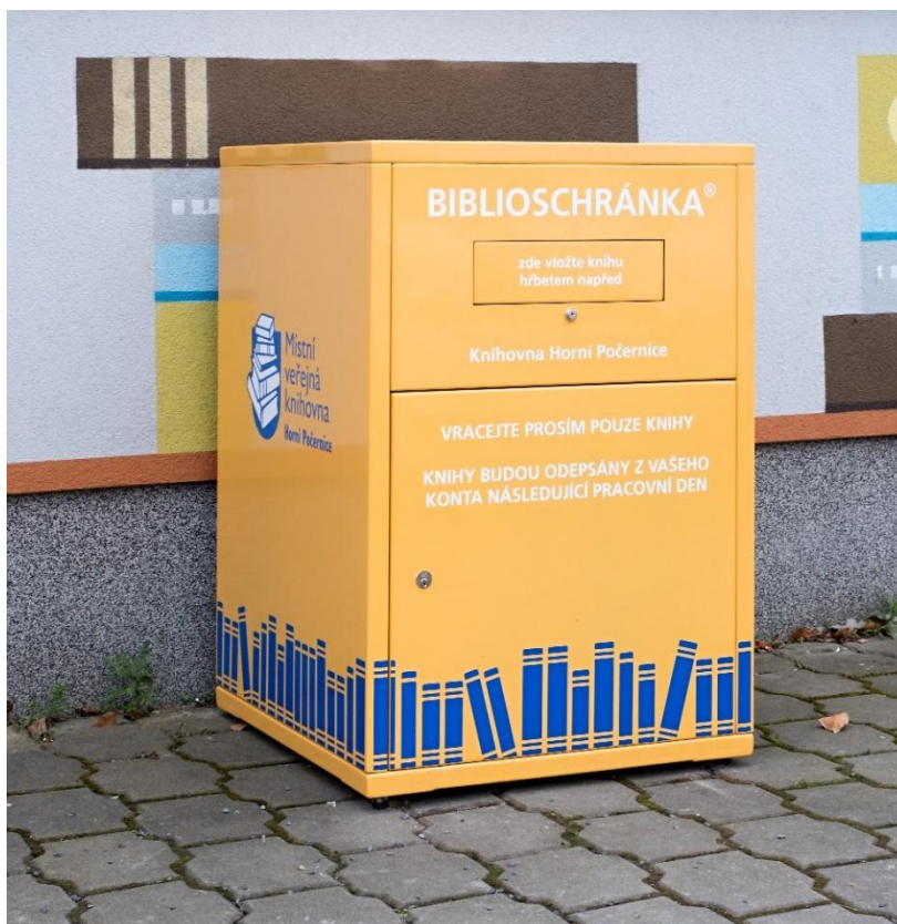
Obrázek 15: Biblioschránka