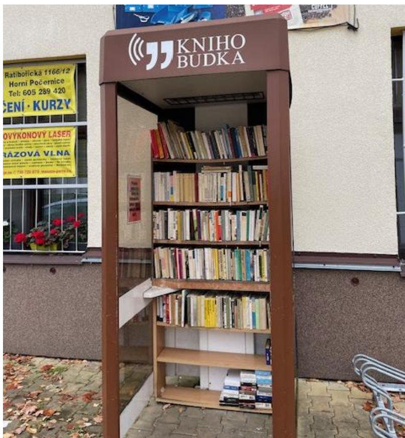
Obrázek 14: Knihobudka