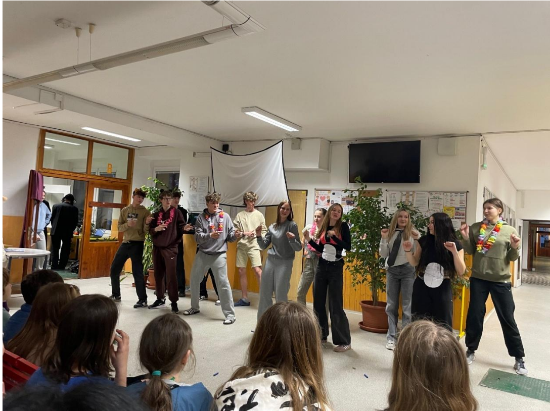
Obrázek 5: Noc s Andersenem – pohádka v podání studentů gymnázia