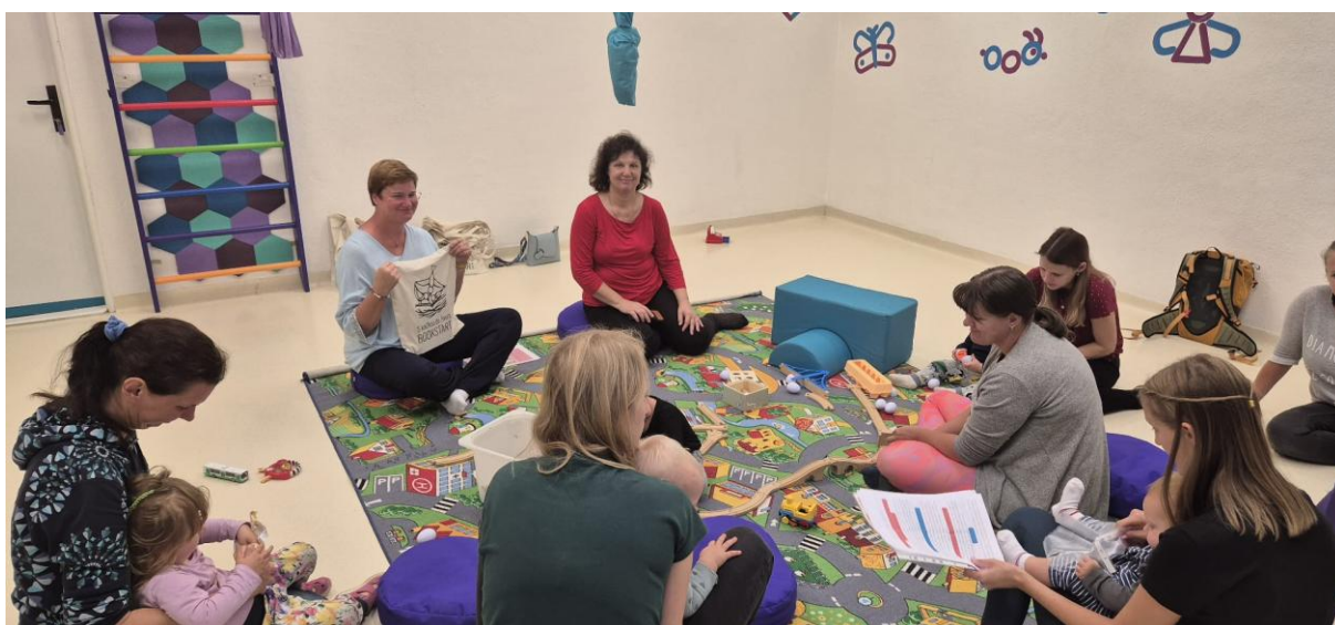
Obrázek 17: S knížkou do života – Rodinné a komunitní centrum Mumraj