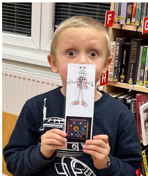
Obrázek 7: Noc s Andersenem – vyrábění záložek *