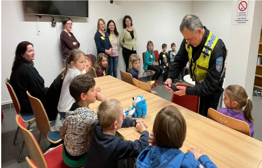
Obrázek 10: Noc s Andersenem – KKC *