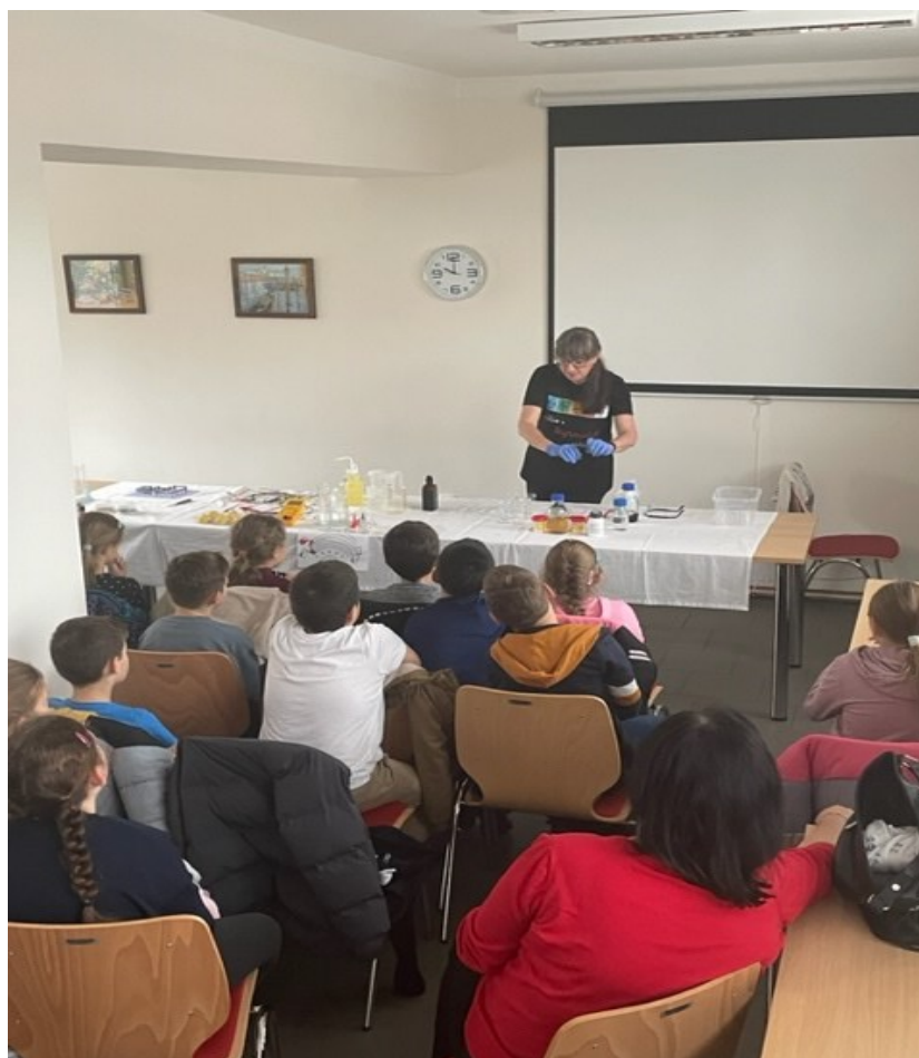
Obrázek 15: Chemické divadélko – Ústav fyzikální chemie J. Heyrovského, Akademie věd ČR