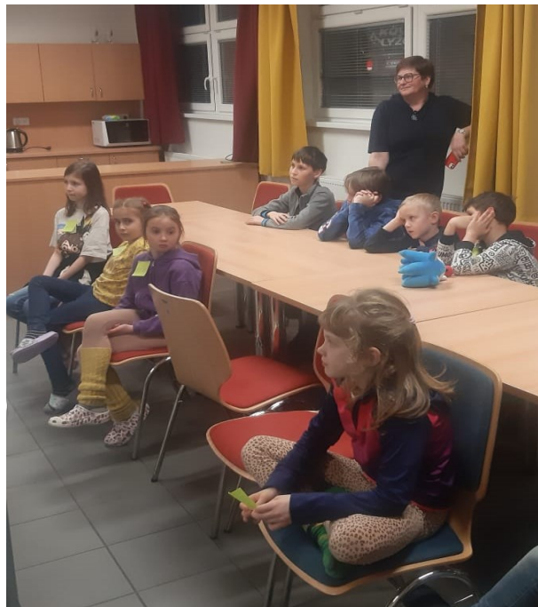
Obrázek 11: Noc s Andersenem – KKC *