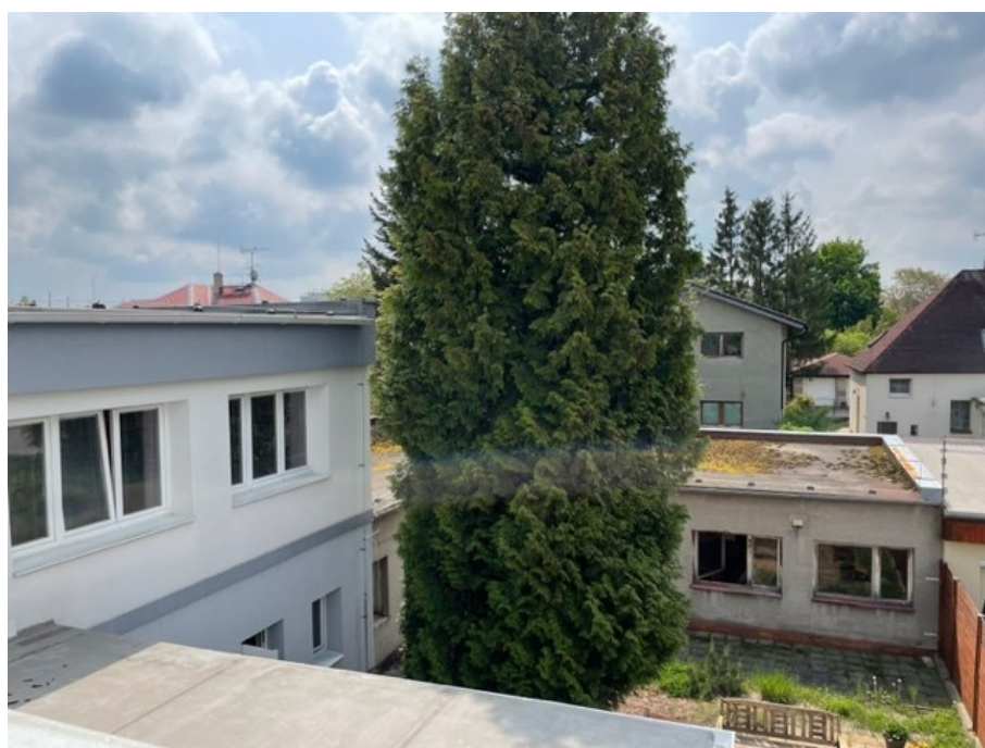
Obrázek 18: Dvorek se sklady