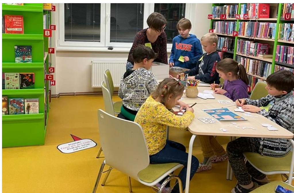
Obrázek 9: Noc s Andersenem – oddělení pro děti a mládež – vyrábění postaviček hrdinů z knížek *