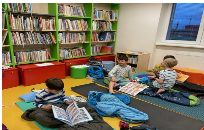
Obrázek 8: Noc s Andersenem – čtení před spánkem *