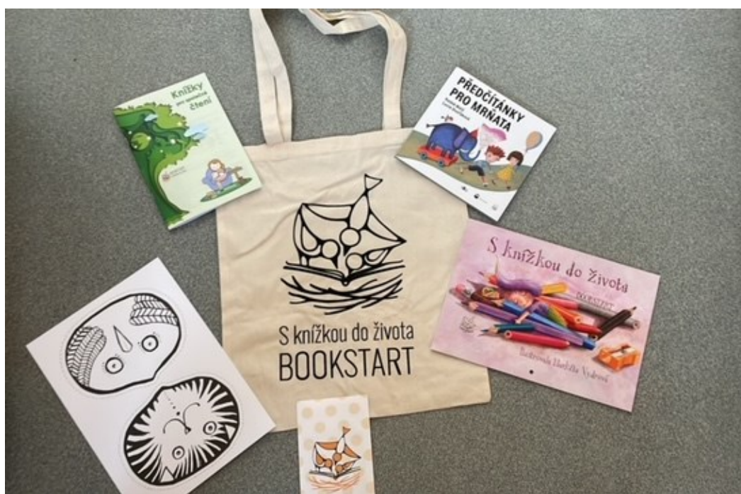
Obrázek 16: S knížkou do života