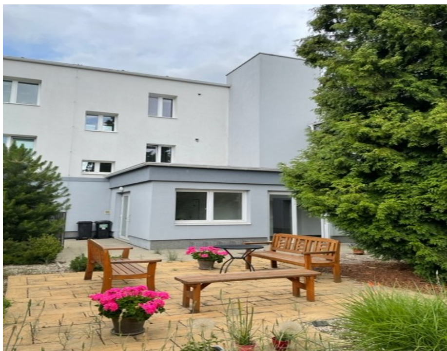
Obrázek 17: Dvorek