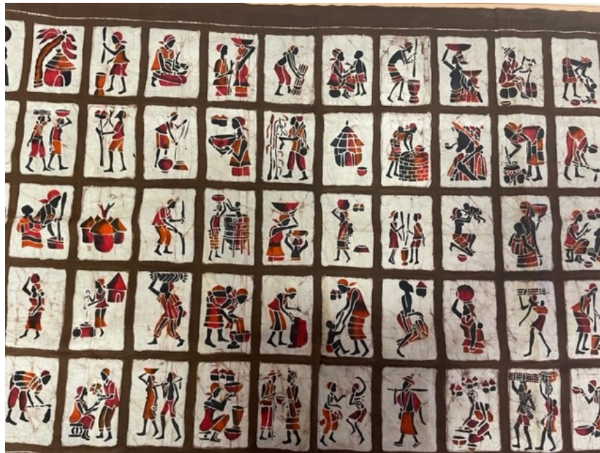
Obrázek 3: Afrika *