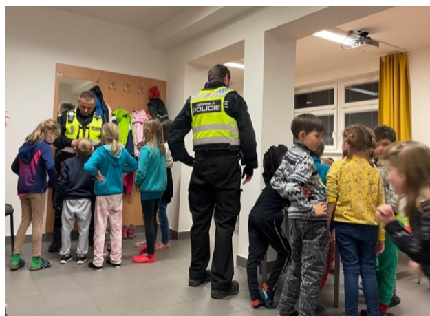
Obrázek 12: Noc s Andersenem – "zatknuti" strážníků dětmi *